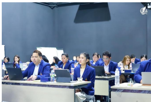
ภาพที่ 1 ถ่ายทอดความรู้เกี่ยวกับการจัดการรายได้ด้านการบริการวิชาการและด้านการวิจัย

(2) การเข้าร่วมกิจกรรมการพิจารณาคัดเลือกผลงานนวัตกรรมเพื่อสังคม (รอบ Final Pitching) ภายใต้โครงการหน่วยขับเคลื่อนนวัตกรรมเพื่อสังคม ประจำพื้นที่ภาคตะวันออกเฉียงเหนือตอนบน ภายใต้แนวคิด “นวัตกรรมเพื่อสุขภาพ และเป็นมิตรกับสิ่งแวดล้อม เพื่ออนาคตที่ยั่งยืน” ของกลุ่มบุคลากรสายวิชาการ วิทยาลัยโลจิสติกส์และซัพพลายเชน