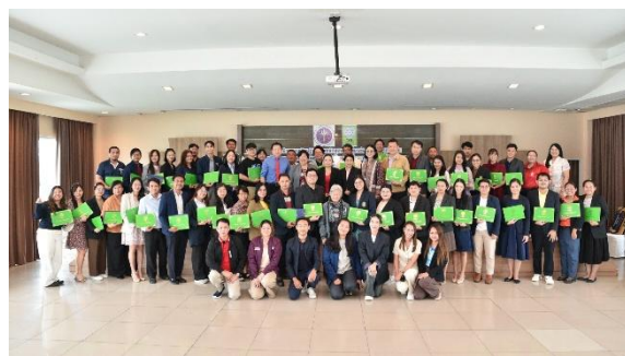
ภาพที่ 4 อบรมเชิงปฏิบัติการหลักการเขียนข้อเสนอโครงการวิจัยที่สอดคล้องกับการวิจัยและนวัตกรรมมิติใหม่ รุ่นที่ 6