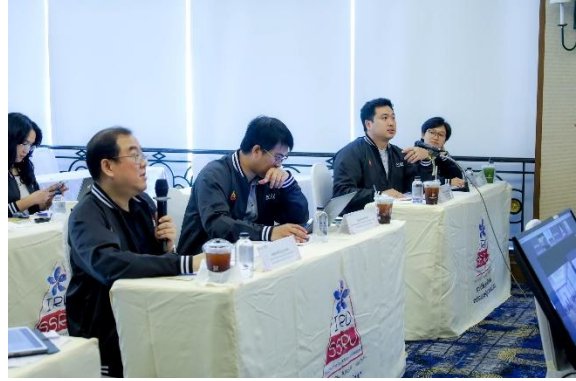
ภาพที่ 2 เข้าร่วมกิจกรรมการพิจารณาคัดเลือกผลงานนวัตกรรมเพื่อสังคม (รอบ Final Pitching) ภายใต้โครงการหน่วยขับเคลื่อนนวัตกรรมเพื่อสังคม ประจำพื้นที่ภาคตะวันออกเฉียงเหนือตอนบน

(3) การเข้าร่วมอบรมเชิงปฏิบัติการหัวข้อ “การเขียน Impact Pathway เส้นทางการสร้างผลกระทบงานวิจัย” ของกลุ่มบุคลากรสายวิชาการ วิทยาลัยโลจิสติกส์และซัพพลายเชน