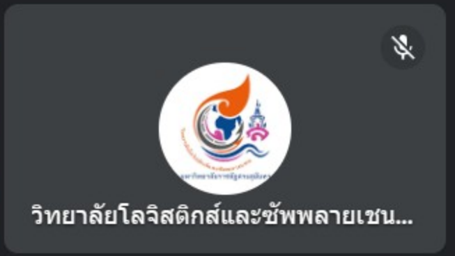
วิทยาลัยโลจิสติกส์และซัพพลายเชน...