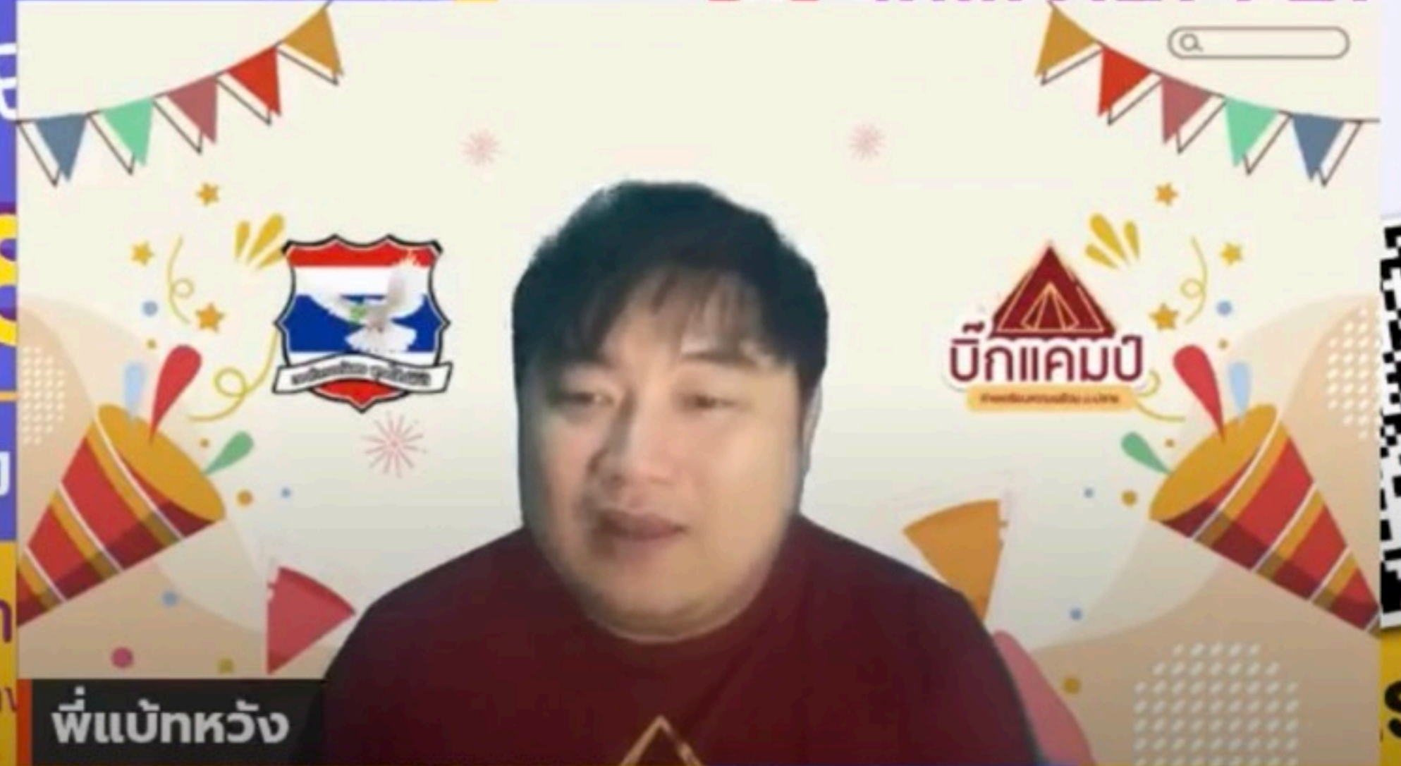
พี่แบ็กหวัง