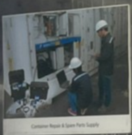
Customer Repair & Spare Parts Supply